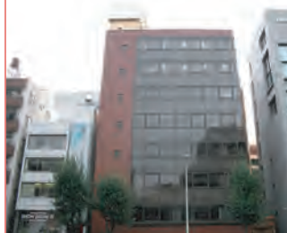
ほっとステーション