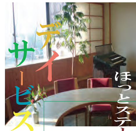
ほっとステーション