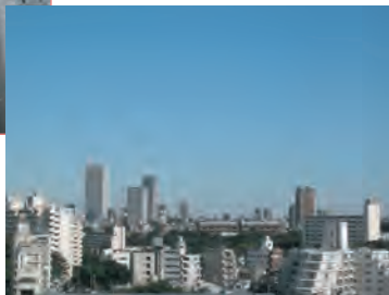
デイルームからの眺め